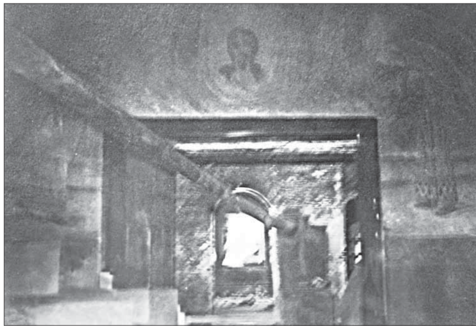
Внутренний вид храма после разгрома.

25 июля 1931 года консультант Орлеанский (к сожалению, точно установить автора письма и место его работы не представляется возможным: с такой фамилией сотрудники были и во ВЦИК и в Мособлисполкоме, а в самом письме нет никаких исходящих пометок, позволяющих определить место работы), кратко изложив историю с закрытием храма, направил во ВЦИК предложение о принятии решения о судьбе храма, предварительно вынеся этот вопрос на суждение комиссии по делам культов. По результатам заседания комиссии президиум ВЦИК 10 августа 1931 года заслушал вопрос о ходатайстве «президиума Московского облисполкома о пересмотре постановления президиума ВЦИК от 20 августа 1930 г. по вопросу закрытия церкви в селе Костино Мытищинского района». Постановил президиум следующее: «В отмену постановления президиума ВЦИК от 20 августа 1930 г. указанную церковь ликвидировать». Заверенная выписка из про-