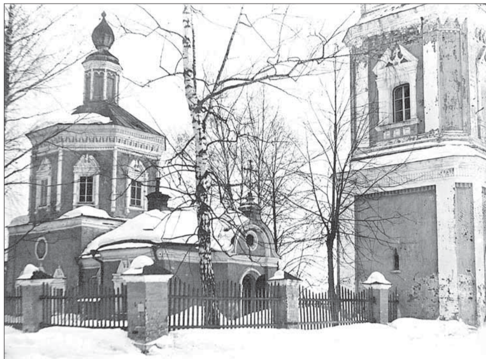
Костино. Церковь Рождества Пресвятой Богородицы в первые годы существования Болшевской трудовой коммуны, 1920-е годы.

20 августа, казалось, верующие могли вздохнуть с облегчением: президиум ВЦИК постановил отменить решение Мособ-