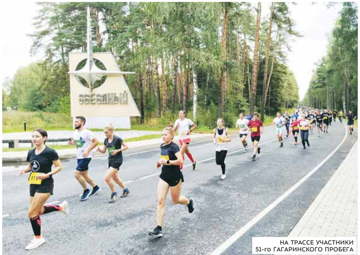
НА ТРАССЕ УЧАСТНИКИ 51-го ГАГАРИНСКОГО ПРОБЕГА

Прекрасный солнечный воскресный день. Перед Домом кос-