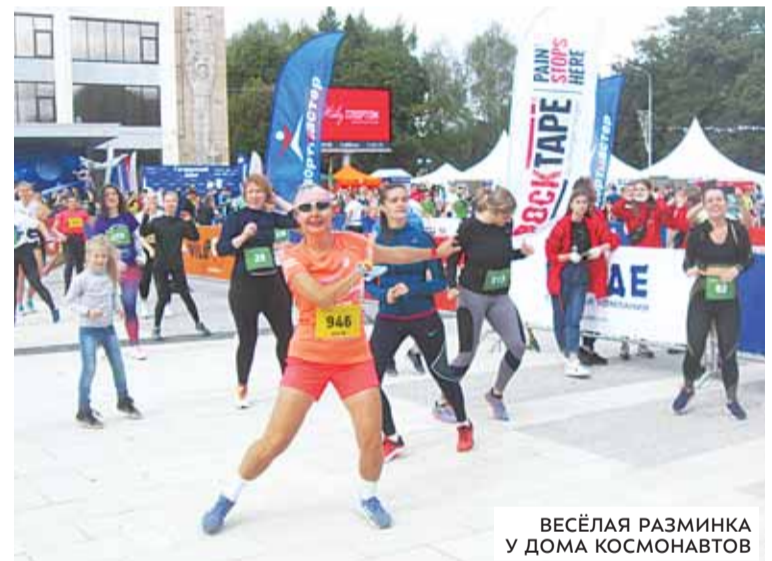
ВЕСЁЛАЯ РАЗМИНКА У ДОМА КОСМОНАВТОВ

Все участники этого пробега получили оригинальные медали от организаторов – спорткомитетов Московской области и Щёлковского района, администрации Звёздного городка, компании «Живу спортом». Победителям вручили ещё и дипломы с подарками от партнёров пробега.