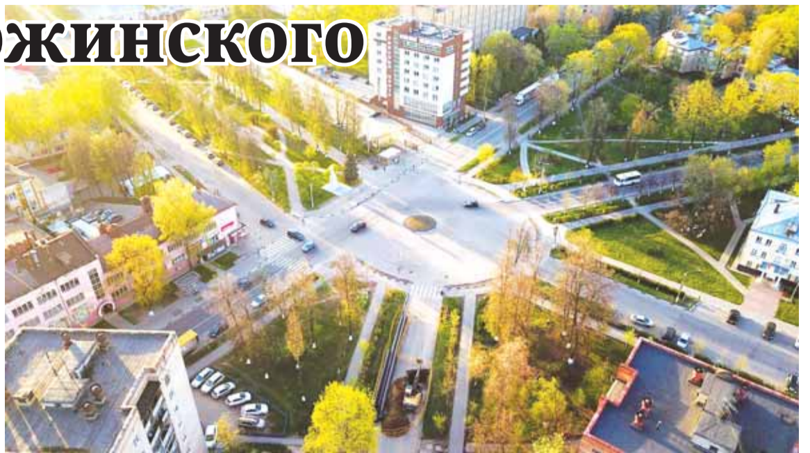
Площадь Дзержинского, 2018 год.

Из документов 1940 — 1960-х годов следует, что площадь с таким названием находилась в центральной части города. Это видно, например, по тексту протокола сессии Калининградского горсовета от 7 июля 1948 года: «В целях сохранения асфальтированных дорог по центральным улицам города: Ворошилова, Комин-