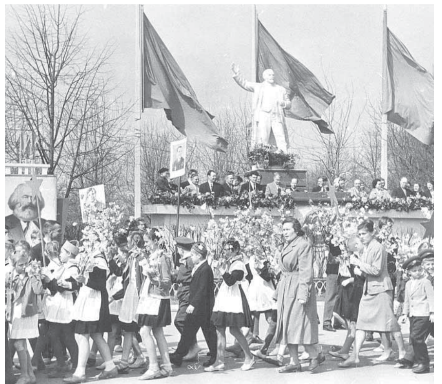
Улица Ленина, разворотный круг. 1950-е годы.

Из-за того, что улица Ворошилова находилась поблизости от