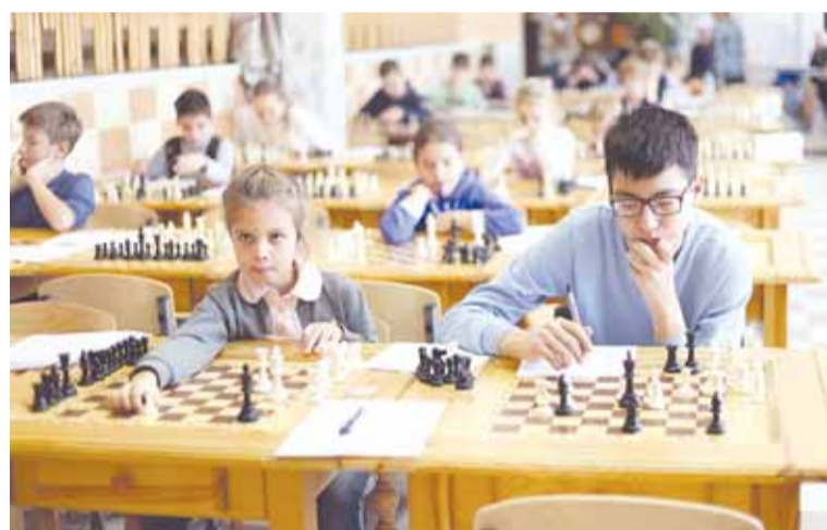
Участники соревнования за решением шахматных задач.