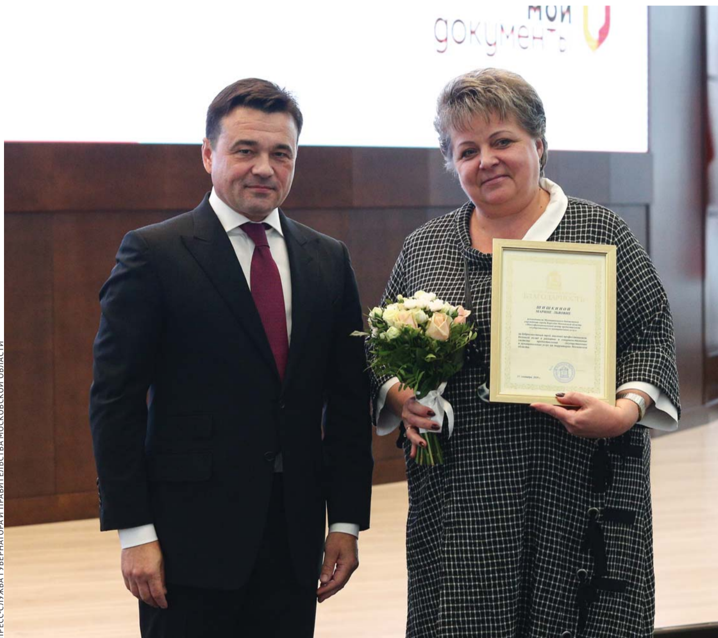
ПРЕСС-СЛУЖБА ГУБЕРНАТОРА И ПРАВИТЕЛЬСТВА МОСКОВСКОЙ ОБЛАСТИ

Благодарность Губернатора Московской области объявлена коллективу Мо-