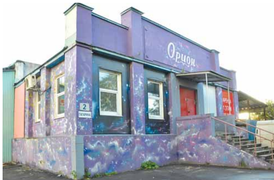
Здание, которое использовалось под продуктовый склад спецлагеря.

Фактическое закрытие лагеря началось в ноябре-декабре 1945-го. Официальное проведено в мае 1946-го. В акте о ликвидации от 27 мая 1946 года сказано, что 421 человек (те, кто не успел пройти проверку СМЕРШ) переведены в Калининградское лагерное отделение Проверочно-фильтрационного лагеря №0334. Остальной спецконтингент (точное число не названо) «передан в постоянные кадры завода №88», то есть люди освобождены и были приняты на работу в качестве вольнонаёмных.