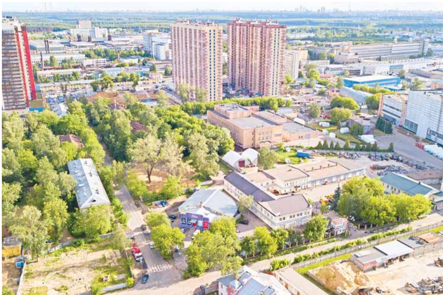
Западная часть улицы Гагарина. Приблизительное место, где находился спецлагерь.

Состав контингента с течением времени менялся. Интересен в этом смысле документ под грифом «совершенно секретно» от 26 июля 1943 года, подписанный начальником Управления по делам (о) военнопленных и интернированных Петровым: «В связи с поступающими от некоторых лагерей запросами о возможности освобождения из лагерей и передаче в Райвоенкоматы – из числа спецконтингентов бывших военнослужащих, прошедших проверку через органы «Смерш» – предлагаю принять к неуклонному руководству нижеследующее: 1. Мл. комсостав и рядовой состав из числа спецконтингентов, находящихся в лагерях – в Райвоенкомат не направлять; без разрешения Управления (последние слова – приписка от руки).