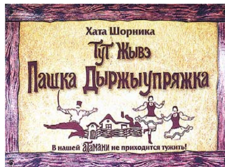
ВЫВЕСКА НА ПОДВОРЬЕ ШОРНИКА