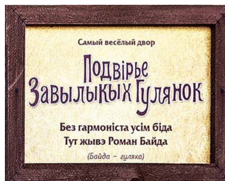
ВЫВЕСКА НА ПОДВОРЬЕ ГУЛЯНОК