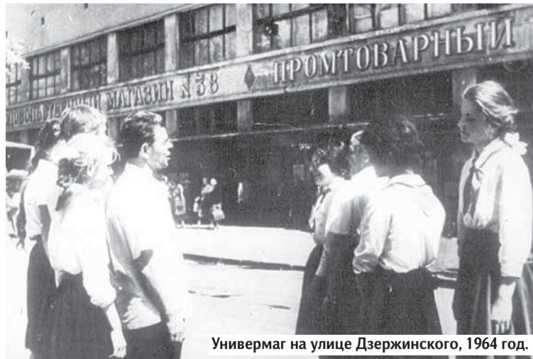
Универмаг на улице Дзержинского, 1964 год.

«Болшево», в котором впервые были собраны вместе многие документы и воспоминания ещё живших тогда коммунаров. Рассматривая эти документы, я неожиданно обнаружила расхождение между установившимися представлениями о коммуне и документами. Во-первых, как я уже сказала, поразил возрастной состав коммунаров. У большинства обывателей представление о коммуне связано с филь-