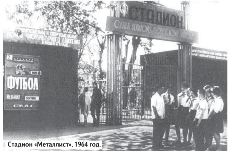
Стадион «Металлист», 1964 год.

мом «Путёвка в жизнь», который снимался в Болшеве. На самом деле было не совсем так. Коммунары Болшева были в подавляющем большинстве старше 18 лет. Средний возраст 25 лет и выше. Совместно с болшевской коммуной ликвидации подлежали так-