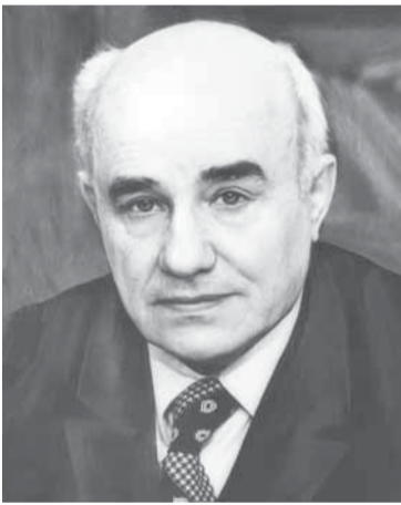
Н.П. Дубинин. Всемирно известный генетик, академик АН СССР, бывший воспитанник БТК.

Первой всколыхнулась общественность. Ею в начале 1918 года (то есть через несколько месяцев после Октябрьской революции) была создана общественная организация «Лига спасения детей» во главе с писателем Владимиром Короленко. Ею же была выдвинута идея создания детских колоний – мест компактного поселения детей, вывезенных из особенно бедствующих регионов страны. Расселяли их в сельских местностях. Государство предоставляло землю и какую-никакую живность, какое-никакое жильё и весьма скуд-