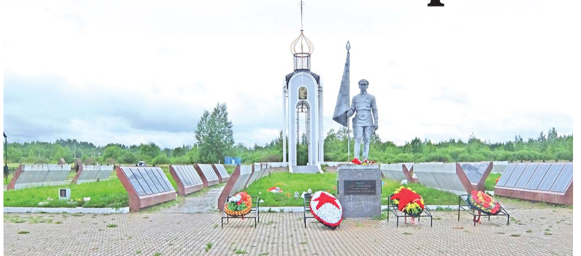
Мемориал «Мясной Бор» воинам Волховского фронта.

План Ставки замкнуть и окружить немецкие части