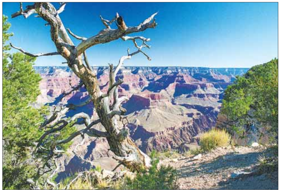
На краю Каньона.

По данным из Интернета, как сказали мне американские друзья, следовало, что в кемпинге можно взять на прокат палатку, а спальник и коврик я уже приобрёл. Но, как говорится, «гладко было на бумаге» – проката палаток в кемпинге не оказалось. А самые дешёвые в магазине стоили несколько сотен долларов. И вот здесь мне, наконец, впервые в поездке повезло. Рядом оказалась дама, служащая в парке рейнджером и говорившая по-французски, который знаю и я. Оказалось, что она не так давно переехала в Штаты из Квебека (Канада), а выросла в Швейцарии, в Лозанне, где мне однажды тоже