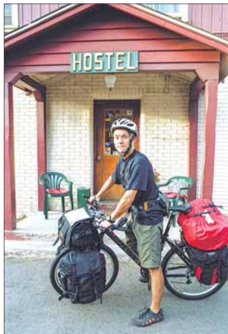
Хостел в Флагстафе.

От Флагстафа до Каньона примерно 80 миль, и доехать можно автобусом от железнодорожного вокзала. Из-за задержки