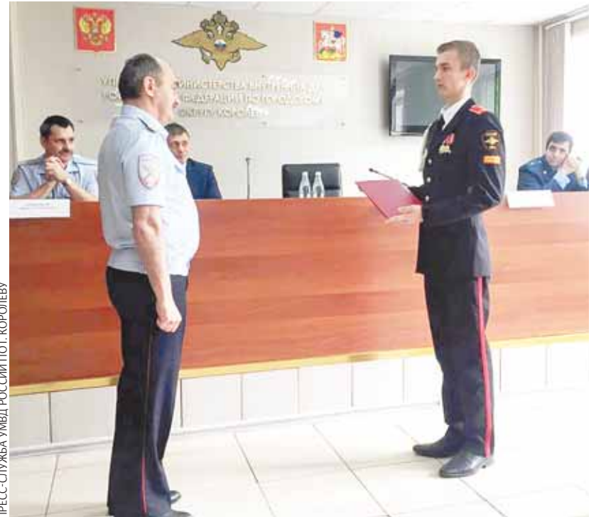
ПРЕСС-СЛУЖБА УМВД РОССИИ ПО Г. КОРОЛЁВУ

По результатам работы за I полугодие 2017 года количество преступле-