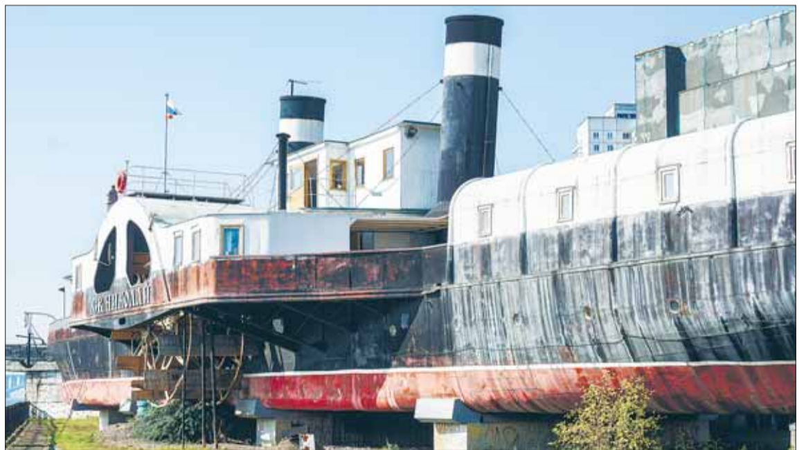
Пароход «Святитель Николай».

Набережная находится на левом берегу, рядом с центральной частью города. Она благоустроена, здесь всегда много гу-