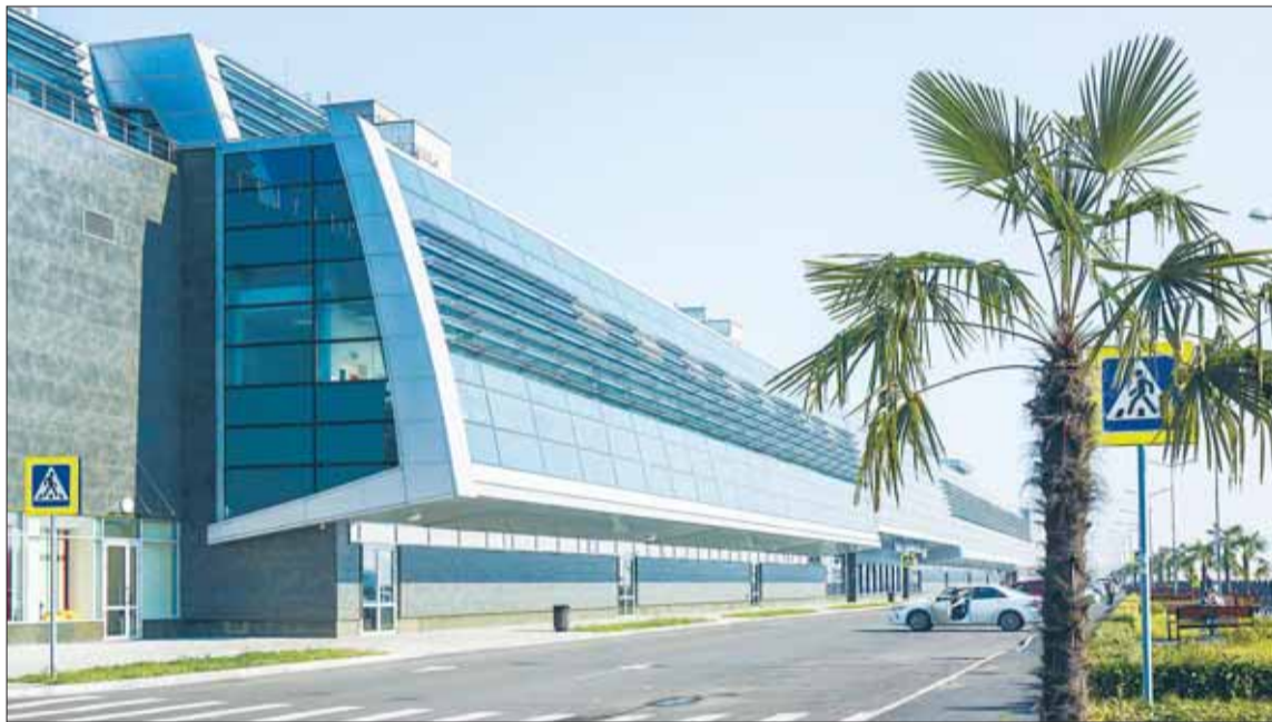
Пальмы на набережной Енисея.

Ещё один мост — Коммунальный — знаменит тем, что, наряду с часовой, также изображён на десятирублёвой купюре. Мост стал украшением города и известен в мире как образец так называемого позднего сталинского ампира. Проектировщики и строители моста были отмечены ленинской премией за использование пе-