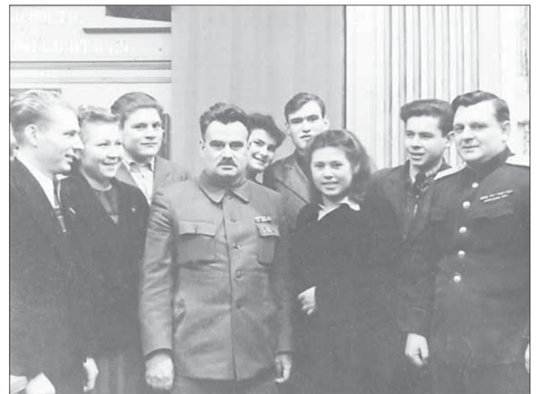
Работники завода № 88 с Иваном Лихачёвым (в центре), директором Московского автозавода.

та мастерская по изготовлению валенок, в том числе для фронта, был заложен пионерский лагерь близ Загорска, за чистотой улиц строго следили. В военное время вдоль них были высажены кустарники, на заводе изготовили металлические решётки, украшенные артиллерийскими эмблемами и... корпусами «лимонок», был заложен заводской сквер. К концу войны город преобразился. В войну завод №88 был поистине градообразующим предприятием.