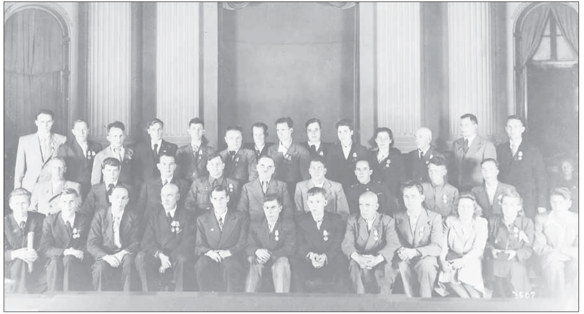
Награждение коллектива завода № 88.

на заводе был создан научно-исследовательский сектор, работы которого широко использовались далее в производстве ракетной техники, когда завод №88 стал опытным в структуре созданного НИИ-88.