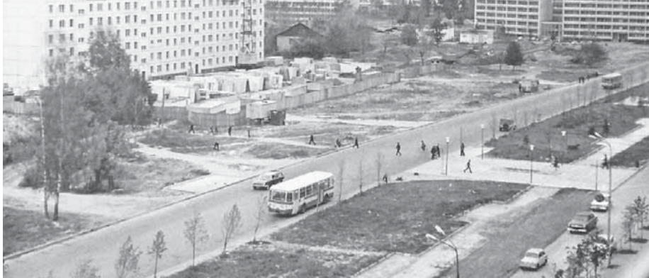
Вид на три корпуса МЖК с балкона дома 11, пр-т Королёва. Середина 70-х годов.