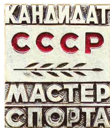
Такие значки получали кандидаты в мастера спорта СССР (срок действия значка – 3 года).