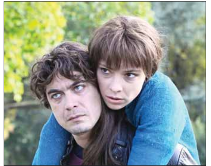
Кадр из фильма «Никто не спасётся в одиночку».

На церемонии закрытия 37-го Московского международного кинофестиваля Никита Михалков сказал о своём преклонении перед гением Федерико Феллини, которому он готов был целовать руки за его фильмы. Великое дело — талант! Но и великое дело — поддержка таланта, в том числе на фестивалях мирового значения, каким был и остаётся Московский между-