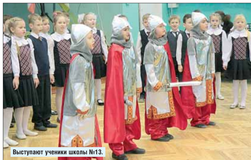
Выступают ученики школы №13.