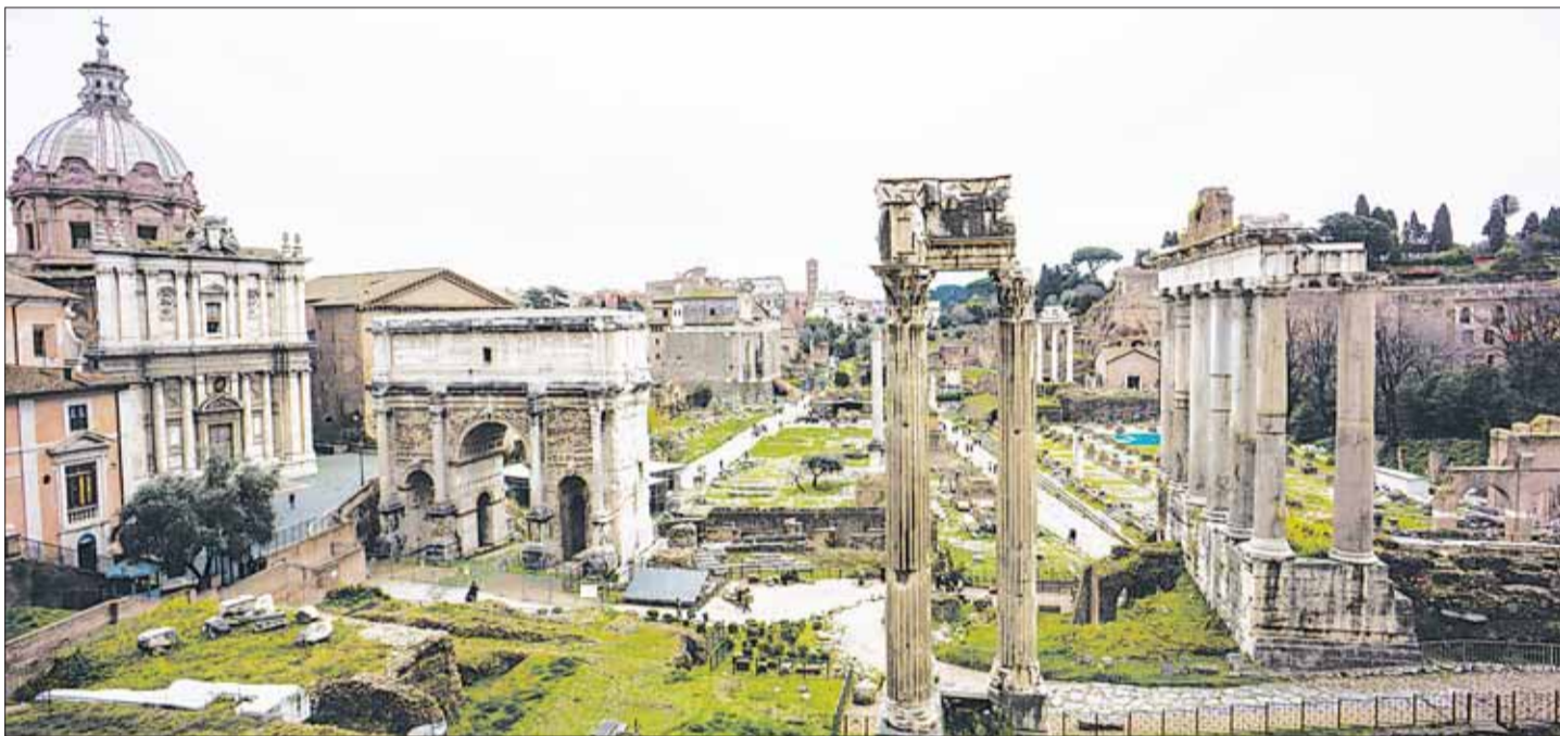
Здесь был центр Вечного города.

Капитолийский холм – самый крутой из 7 холмов Рима. В древности на этом месте находилось главное святилище Рима – храм Юпитера. Здесь вступали в должность консулы, устраивали торжественные собрания сенаторы. По соседству стояло святилище Юноны Монеты, при котором жили пресловутые гуси, предупредившие спящих римлян о нападении. Там же чеканили деньги, которые в честь храма стали называть монетами.