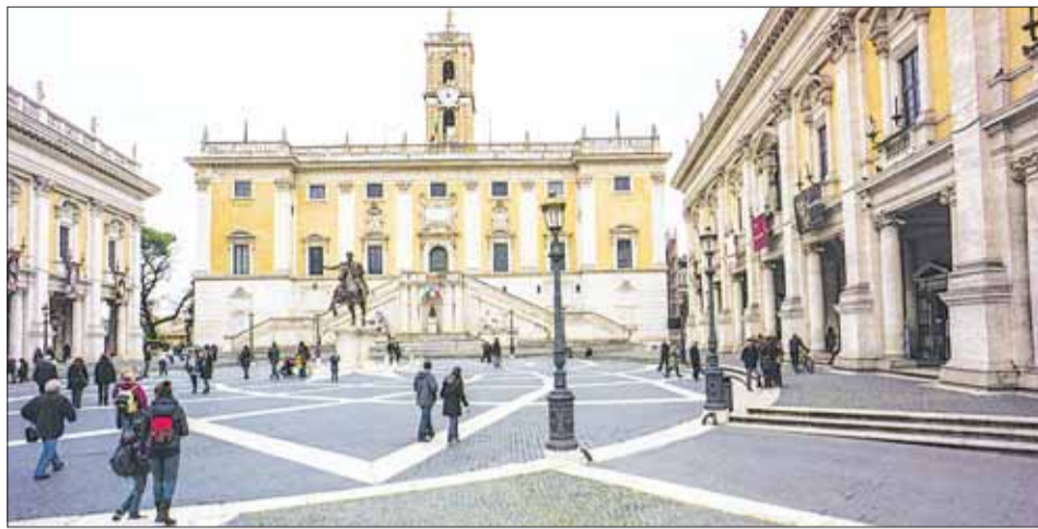
На Капитолийском холме.

В античном Риме Форум родился как место для торговых рядов, но после объединения города в единое целое он стал идеальным центром Рима. Здесь стали