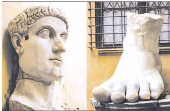
За дело взялся римский Церетели...

Находящаяся на площади Святого Петра в форме овала колоннада как бы соединяет собор с городом и со всем христианским миром. Колоннада из поставленных в четыре ряда 284 колонн построена по проекту архитектора Джованни Бернини в 1656–1667 годах и у неё есть интересная особенность. В центре площади находятся две точки, отмеченные белым мрамором. Если стать на одну из них, то четыре колонны из разных рядов сольются и будут видны только первые колонны. Покажется, что колоннада состоит только из одного ряда колонн. Стоит сделать шаг в сторону, и колонны как бы оживают и начинают двигаться сами.