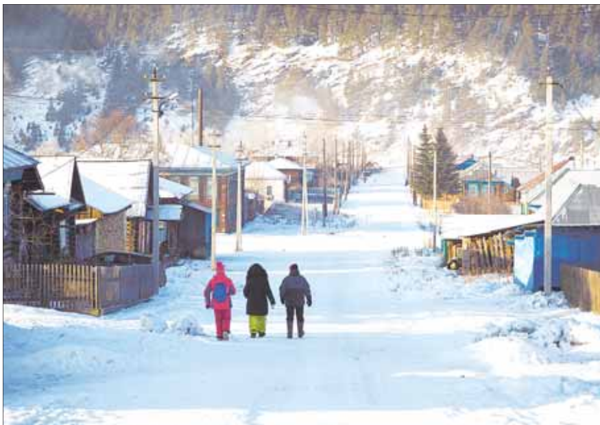
Улица в Каге.

Много лет храм служил кагинцам и жителям окрестных деревень. В 1933 году этот Никольский храм закрыли, колокольню разрушили, священника арестовали. До 1938 года церковь пустовала, затем там устроили библиотеку, потом — зернохранилище для местного колхоза. Ещё одна страница в истории храма — его отдали под сельский клуб. В это время большинство настенных икон было покрашено. Когда несколько лет назад храм вернули церкви, здесь начались ремонтно-реставрационные работы. Сегодня для церковных служб пригоден