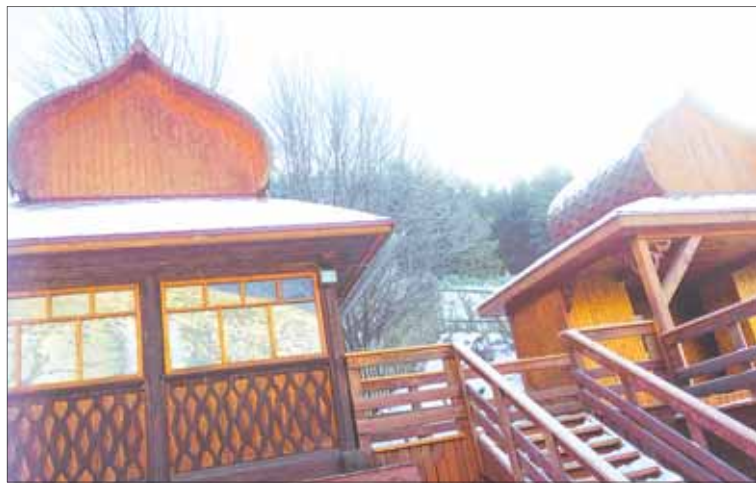
Часовня на Сажелке.

возвышении, видно со всех сторон. Здесь стоит величественный каменный храм, отсюда и началась наша экскурсия.