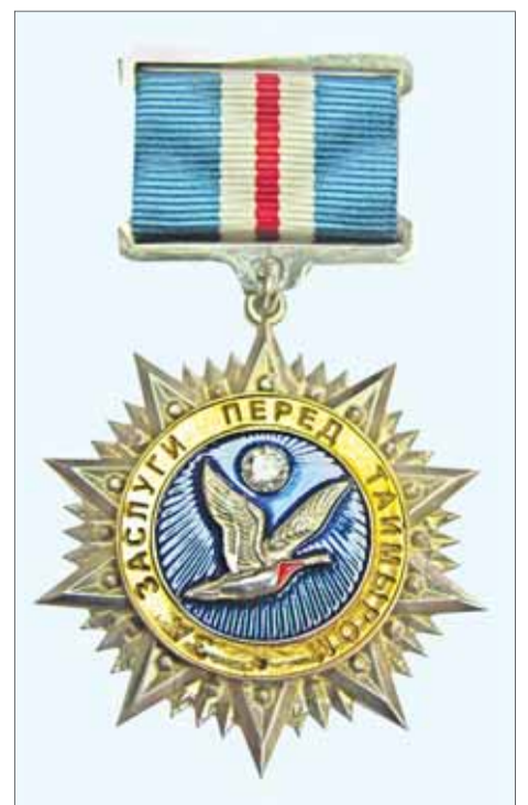
Этот знак выполнен из серебра 925 пробы с золочением и покрыт эмалью.

В моём архиве сохранилась фотография встречи Георгия Гречко с руководством Норильска и Норильского горно-металлургического комбината. Среди журналистов, принимавших участие в этой встрече, был и я (на фото слева от Гречко). Среди многочисленных наград космонавта №34 есть и почётный знак «За заслуги перед Таймыром» (на фото), вручённый космонавту согласно постановлению №525 главы Таймырского Долгано-Ненецкого автономного округа Красноярского края.