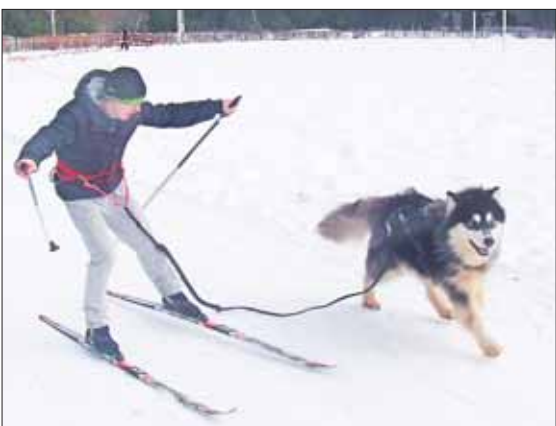
Такие собаки помогают людям с ограниченными возможностями.

Спортсмены Королёвского общества инвалидов второй раз приняли участие в этих играх. Ранним солнечным утром наша команда из восьми человек разместилась в автобусе и отправилась представлять спорт нашего города. К нашему удивлению, мы, не попав в пробки, уже через два с половиной часа прибыли к месту старта. Получив спортивный инвентарь и номера, наши спортсмены встали на построение.