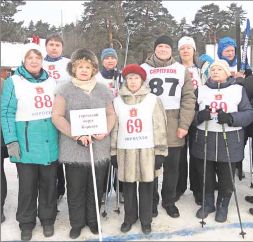
Команда Королёва перед соревнованиями.