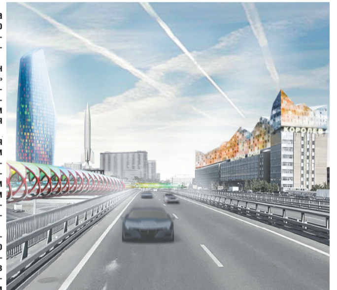
1 Пионерская улица: парадные «ворота» наукограда

Знаковая для города территория – на углу Ярославского шоссе и Пионерской улицы – может быть преобразована в бизнес-парк с высотной доминантой – градостроительным ориентиром на въезде в наукоград.