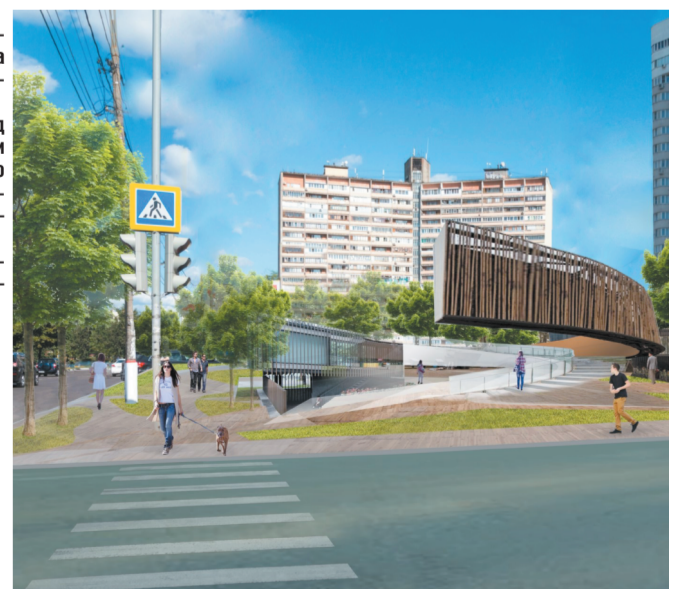
2 Новый облик проспекта Королёва с расширением пешеходных зон

Часть площади будет предназначена для проведения городских ярмарок.