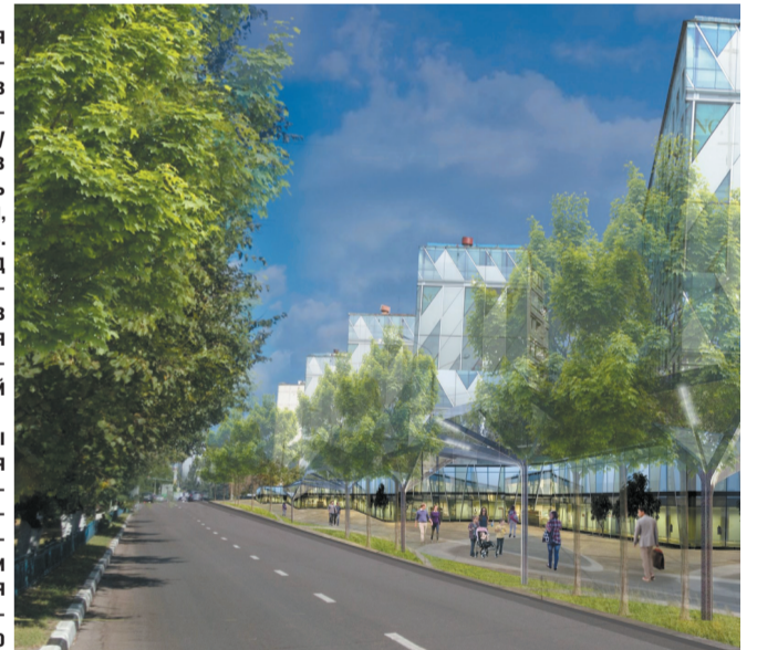
2 Новый облик проспекта Королёва с расширением пешеходных зон

На границе пешеходной зоны и проезжей части предлагается посадить деревья, сделать газоны и устроить навесы с подсветкой для использования в вечернее время. В оформлении торцов «Пилы», в мощении и для уличного освещения предлагается использовать космическую тематику.