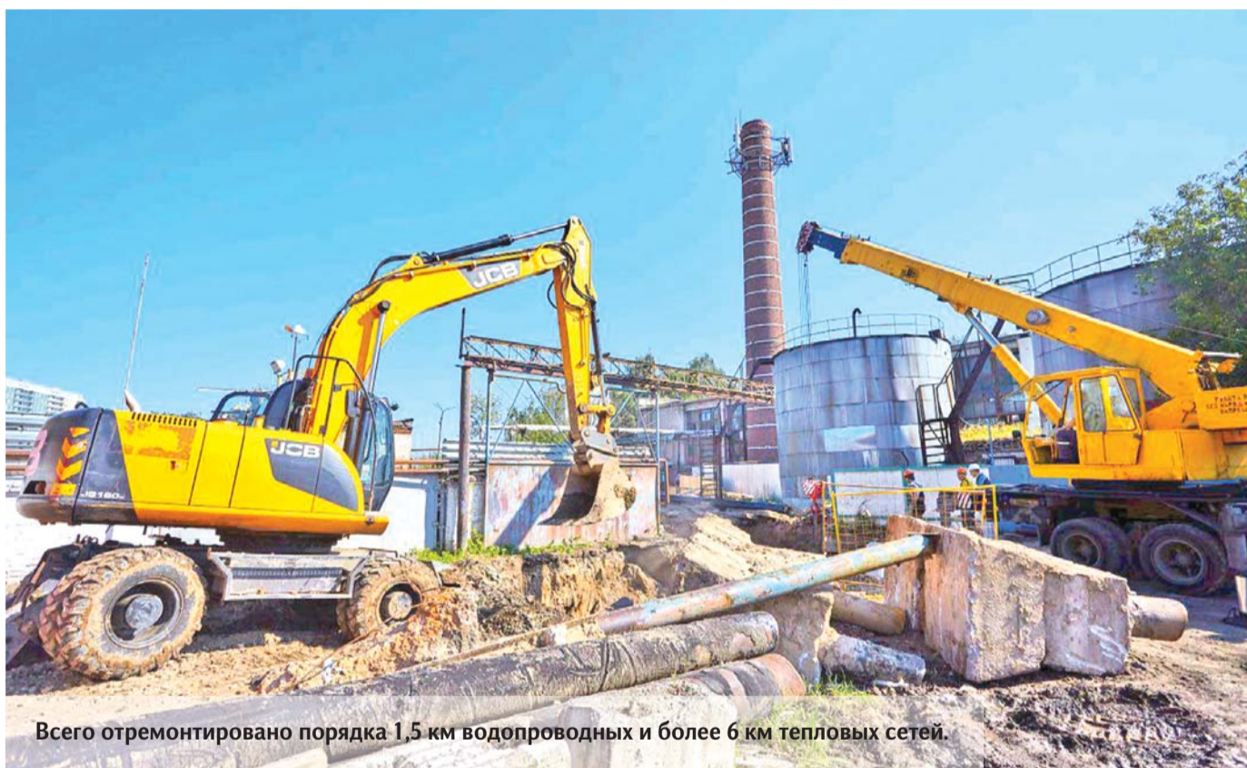
Всего отремонтировано порядка 1,5 км водопроводных и более 6 км тепловых сетей.

В прошлом году было сделано исключение по просьбам жителей, тогда отопление в домах Королёва дали уже 25 сентября. В целом в Подмоскovie отопительный сезон начался позже.