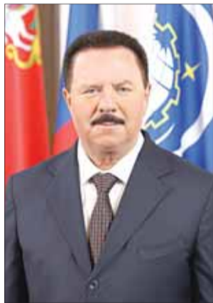
Глава Королёва Александр ХОДЫРЕВ