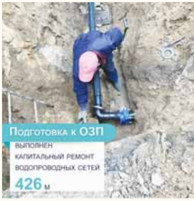
Подготовка к ОЗП выполнен капитальный ремонт водопроводных сетей 426 м

по состоянию на конец июня выполнены работы на водопроводных и канализационных сетях. Выполнен капитальный ремонт 426 м и промывка 6080 м водопроводных сетей, а также промывка 1720 м канализационных сетей.