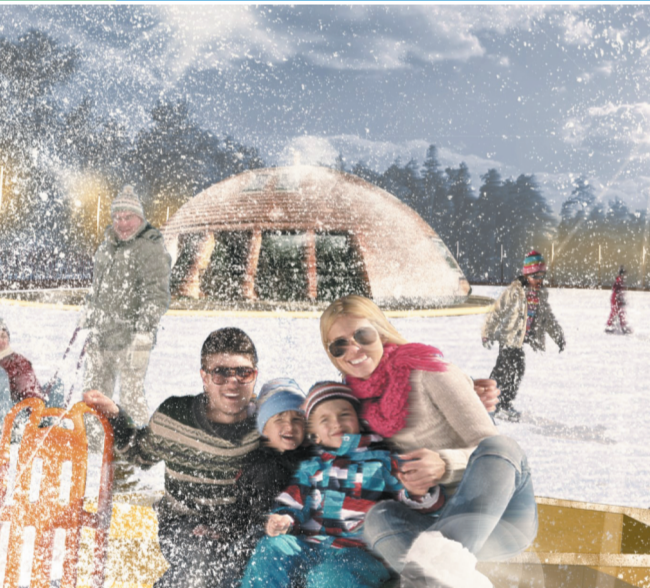
8 Развитие зоны отдыха у пруда в микрорайоне Юбилейный

Новыми элементами благоустройства станут тематическая «тропа» с информационными стендами на тему космонавтики и завершающая её плавучая сцена, вынесенная непосредственно на водную поверхность. Площадка, с трёх сторон окружённая водой, может использоваться для проведения мероприятий и праздников — музыкальных концертов и сценических постановок, особенно зрелищных благодаря отражению в воде и природному фону, пикников, выставок и даже рыбалки или пуска моделей судов. Зимой сцена оборудуется легким павильоном для кафе, раздевалки и спортивного проката.