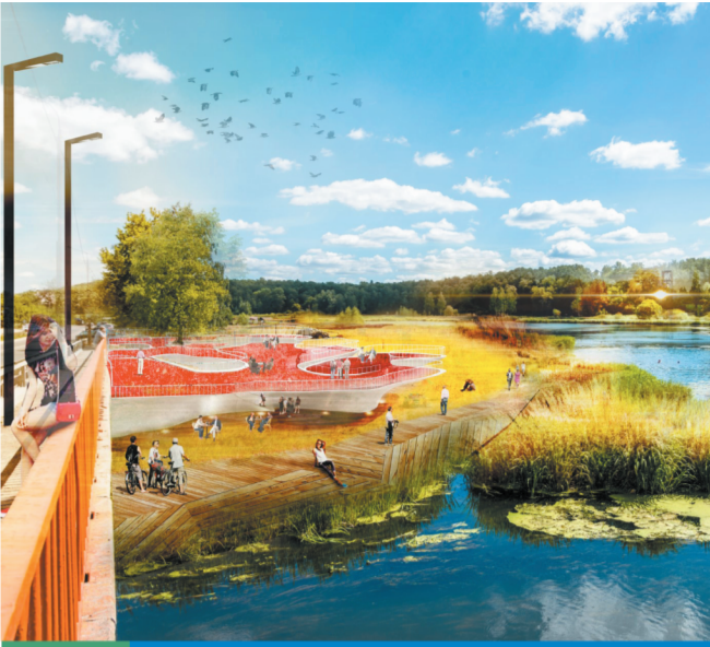
7 Развитие прибрежной зоны реки Клязьмы (набережная, пляжи, ландшафтный парк, велодорожки)

Новые мосты через Клязьму обеспечат доступность территории для маломобильных групп и маршруты для велосипедистов, в том числе и для поездок на работу.