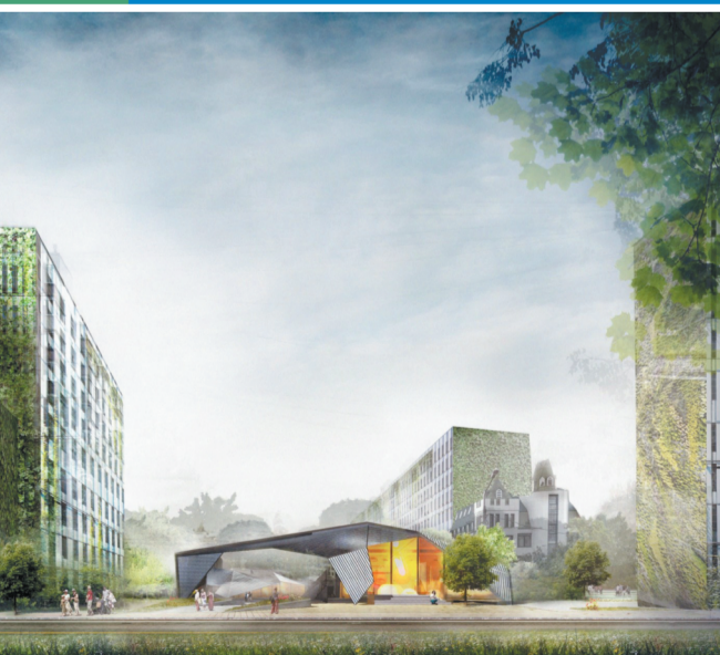
9 Пешеходный бульвар на Пушкинской улице в микрорайоне Юбилейный

Благоустройство центра микрорайона Юбилейный потребует новый облик расположенных здесь зданий — облицовку их фасадов современными материалами, использование первых этажей для торговли, кафе и обслуживания горожан.