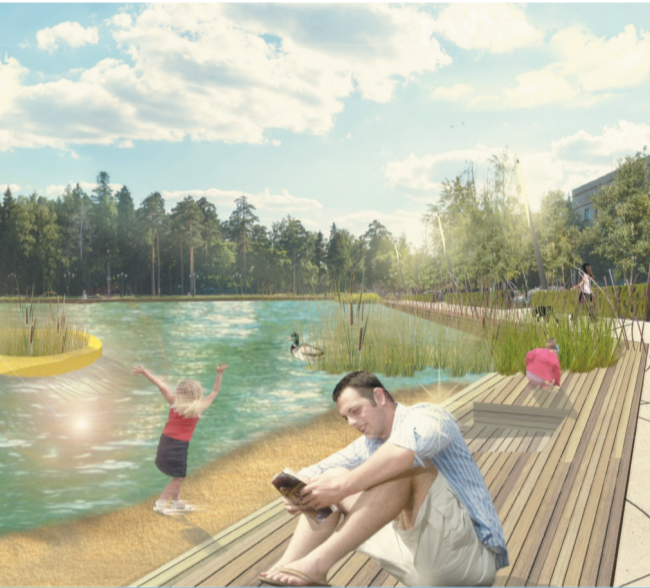
8 Развитие зоны отдыха у пруда в микрорайоне Юбилейный

Между лесопарком и набережной разместятся детские площадки.