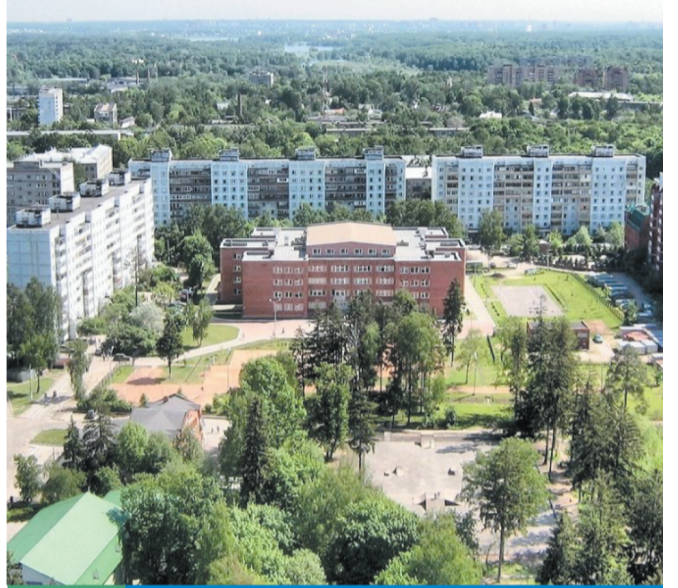
10 Школы — новые общественные центры города

Наличие в школе расширенной программы будет способствовать созданию образовательной среды, из которой вырастут будущие инноваторы.