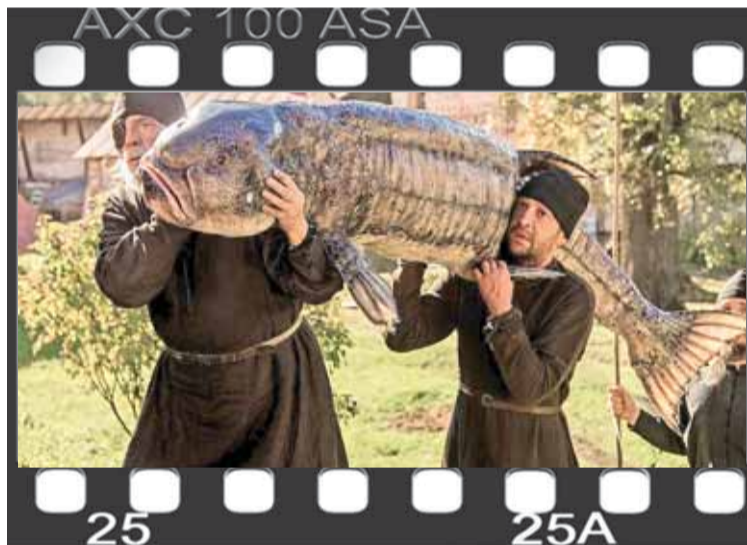
Кадр из фильма «Монах и бес».