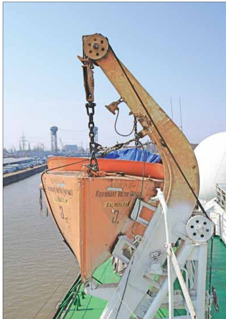
Аварийно-спасательные средства НИС «КВП» — кто будет отвечать за их исправность?