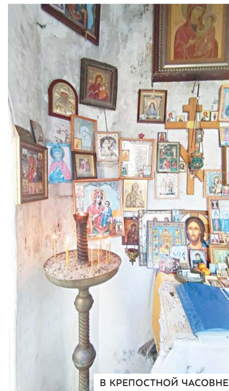
В КРЕПОСТНОЙ ЧАСОВНЕ