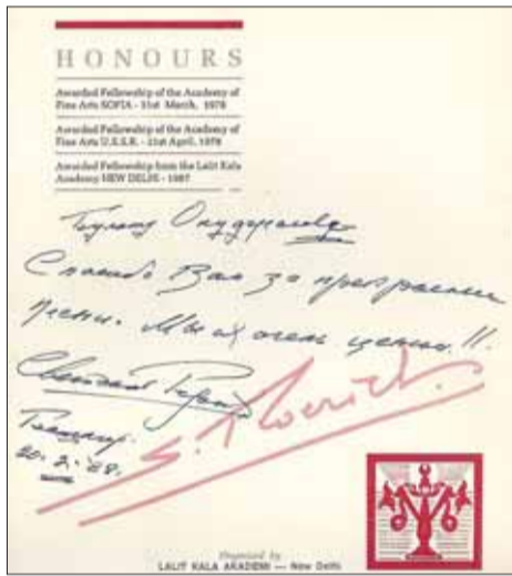
Каталог выставки С. Рериха с автографом.