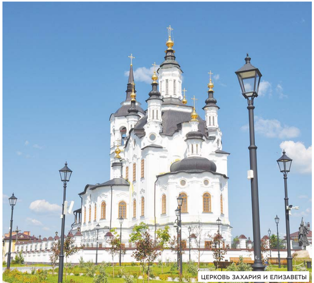
ЦЕРКОВЬ ЗАХАРИЯ И ЕЛИЗАВЕТЫ