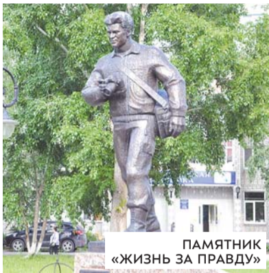
ПАМЯТНИК «ЖИЗНЬ ЗА ПРАВДУ»

Раскинувшийся под горой Нижний посад тоже мало-помалу обретает своё историческое лицо. Ещё в 2019 году территория вокруг церкви Захария и Елизаветы напоминала вспаханное поле, а теперь здесь реконструирована торговая площадь, проведено освещение, позади храма расположились детская игровая и эстрадная площадки, памятник компози-