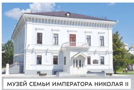
МУЗЕЙ СЕМЬИ ИМПЕРАТОРА НИКОЛАЯ II