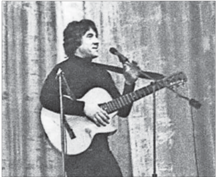
Владимир Высоцкий во время выступления в ДК им. Ленина (ныне — ДиКЦ «Костино»), Калининград (ныне - Королёв) Московской области. 16 июля 1980 г.

«Мы не просто посвятили своё плавание Высоцкому и после этого забыли про него, как многие увлекающиеся люди, а продолжаем по сей день нести знамя Высоцкого. Мы как бы