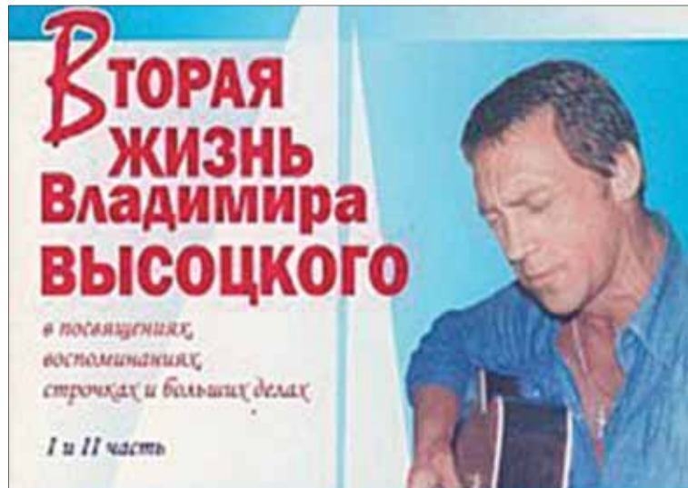
Обложка книги Владимира Корецкого.

Характер — первое, что вспоминают многочисленные скульпторы и художни-