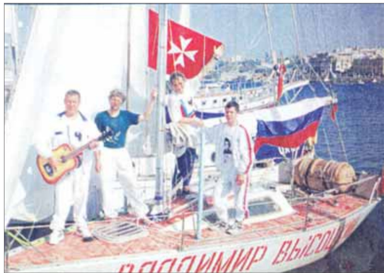
Экипаж яхты «Владимир Высоцкий» во время перехода Волгоград–Св. Афон–Пирен–Мальта–Корсика–Мадейра–Бермуды–Кливленд–Торонто...