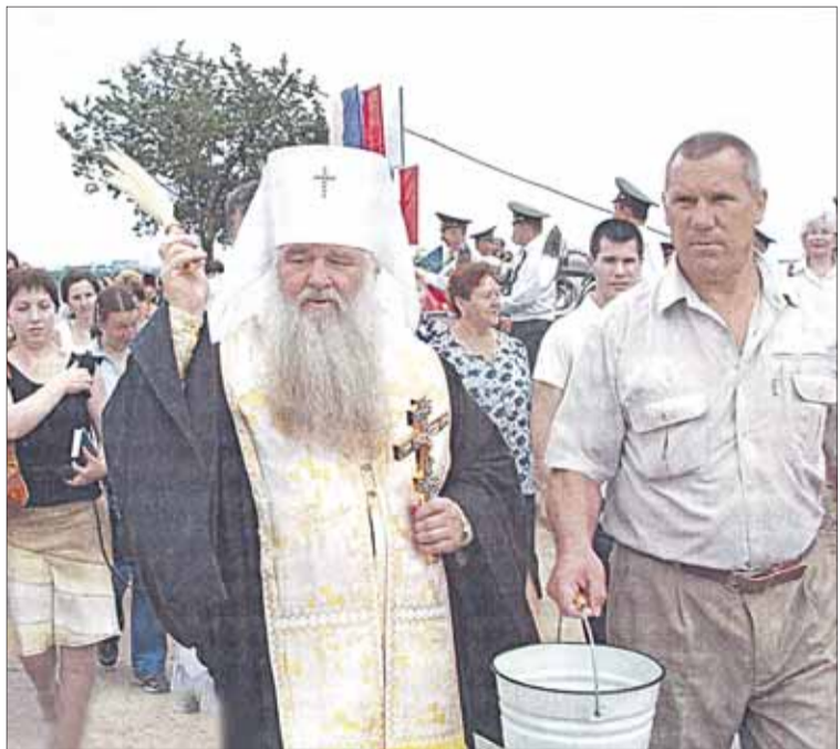
В 2003 году в Волгограде освятили набережную имени Владимира Высоцкого.

«Нет, жить можно, жить нужно и — много: Пить, страдать, ревновать и любить, — Не тащиться по жизни убого — А дышать ею, петь её, пить!» Владимир ВЫСОЦКИЙ