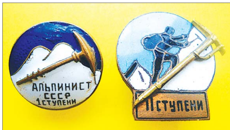
Значок «Альпинист СССР» первой и второй степени.

платформой на фоне гор Кавказского хребта. Вокруг деревья в зелени и клумбы, на которых цвели какие-то необыкновенные цветы. Мы приехали утром, и горы были освещены ярким утренним солнцем. Это создавало эффект театральной обстановки, как будто бы всё это происходило на огромной сцене, а горы были её задником! Стояла ранняя осень, и пассажиров — отдыхающих было мало. Зато наше семейство резко выделялось на этом фоне. Среди встречающих мне в глаза сразу же бросились два пожилых кавказца в одежде мне незнакомой. Чёрные черкески, подпоясанные какими-то необыкновенными поясами, украшенными блестящими насечками, в красивых, обтягивающих ноги сапожках, а самое главное — в шапках. Аксакалы подошли к папе, очень церемонно с ним поздоровались, расцеловались, и только после этого остальные женщины и дети гурьбой бросились ко мне и маме. Мужчины снисходительно отошли в сторону и начали неторопливо расспрашивать о чём-то папу. Я сразу же попал в руки группы мальчишек, которую возглавляла невысокая девчонка, по-видимому, она верховодила всеми этими ребятами. Все они были старше меня и тут же с криком «Мама, мы пошли пить газировку!» потянули меня к тележке, которая стояла под на-