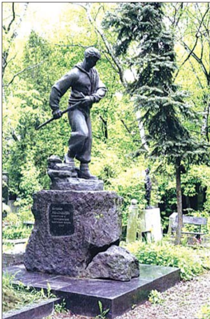
Памятник альпинисту Е.М. Абалакову на Новодевичьем кладбище, Москва.

Когда мы все вышли из вокзала, на площади стояли две или три пролётки, в которые нас разместили не без хлопот, и мы поехали по проспекту этого удивительного, красочного города. По тротуарам ходили люди, одетые в красивые белые одежды. Двери магазинов были открыты, везде что-то было выставлено на продажу, в некоторых играла музыка. Весь проспект был засажен большими деревьями, и мы ехали, как будто по аллее в лесу. В конце проспекта повернули налево, в небольшую улочку. Мне тогда показалось, что она своим концом упирается прямо в гору. Остановились у большого кирпичного одноэтажного дома, ворота во двор были открыты, и нас уже встречали. Папе сразу же поднесли рог с вином, но он тогда совершенно не брал в рот ни водки, ни вина и стал отказываться. Тут тётка Катя, как самая старшая, подошла к нему и стала говорить, что в таких случаях по обычаю горцев нельзя отказываться. Ведь это от всего сердца! Папа взял рог и пригубил, но, видимо, он не знал, как надо пить из рога, вино вылилось ему на грудь гимнастёрки, что вызвало восторг у окружаю-