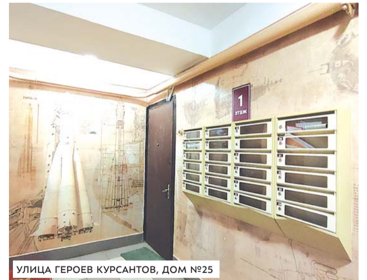
УЛИЦА ГЕРОЕВ КУРСАНТОВ, ДОМ №25

Стены остальных этажей в обоих подъездах выкрашены в нежно-персиковый цвет. Во время ремонта также были заменены светильники, почтовые ящики, уста-