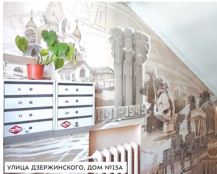
УЛИЦА ДЗЕРЖИНСКОГО, ДОМ №15А

Жители королёвских многоэтажек претендуют на победу в региональном конкурсе