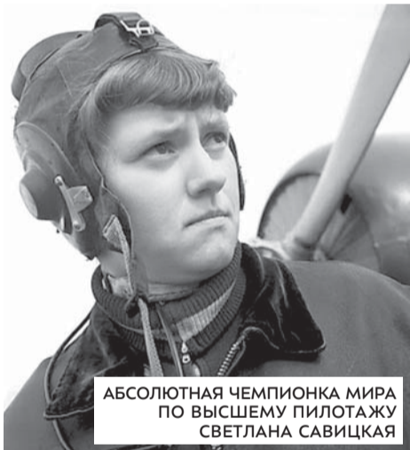
АБСОЛЮТНАЯ ЧЕМПИОНКА МИРА ПО ВЫСШЕМУ ПИЛОТАЖУ СВЕТЛАНА САВИЦКАЯ