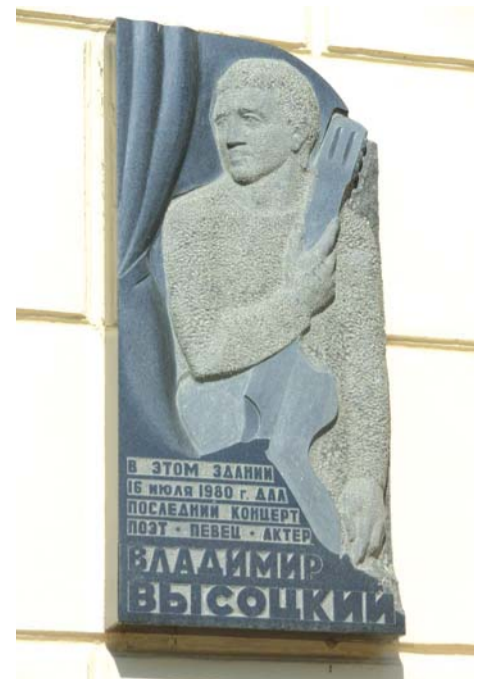
МЕМОРИАЛЬНАЯ ДОСКА НА ДИКЦ «КОСТИНО»