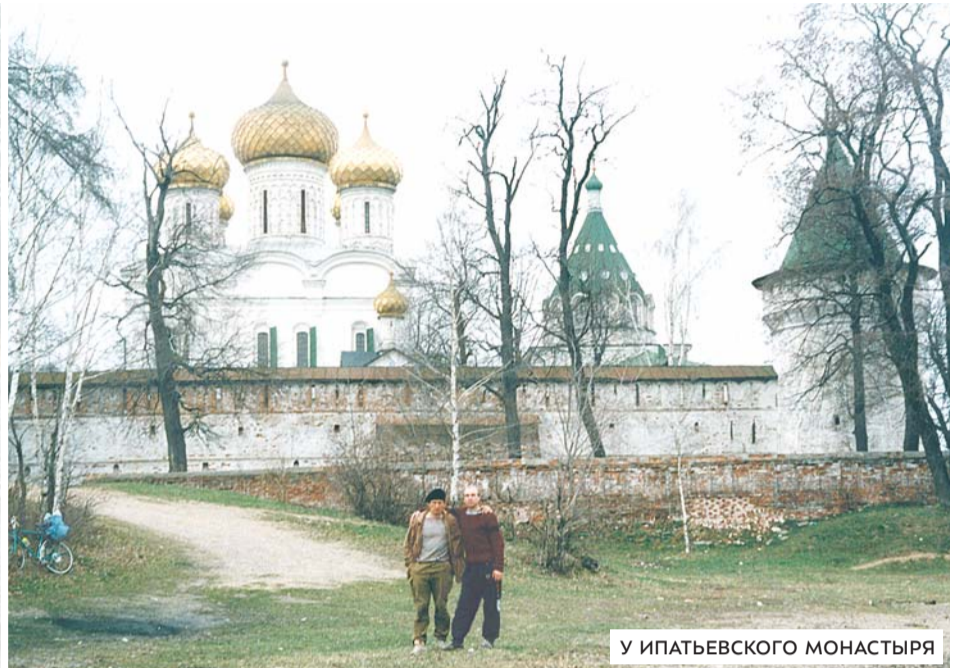
У ИПАТЬЕВСКОГО МОНАСТЫРЯ