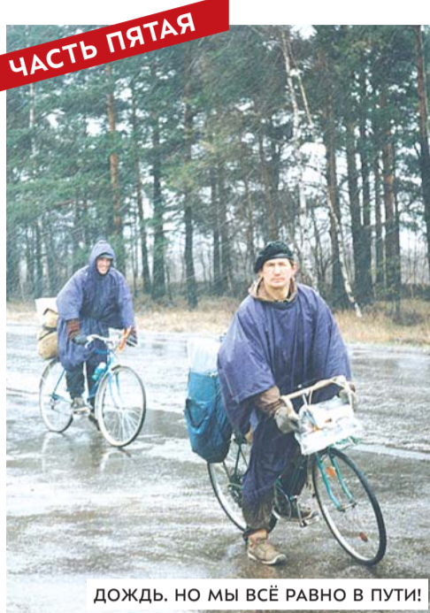
ДОЖДЬ. НО МЫ ВСЁ РАВНО В ПУТИ!