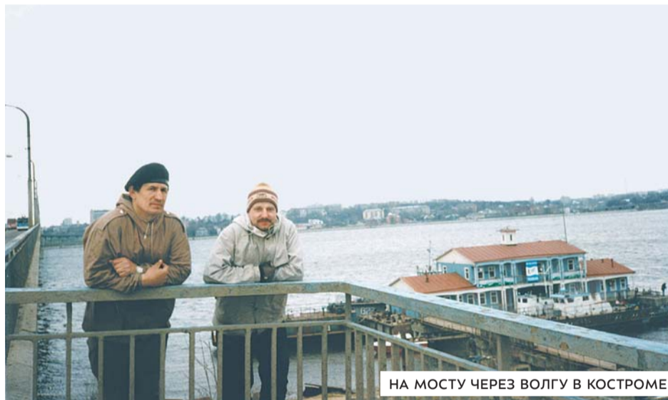
НА МОСТУ ЧЕРЕЗ ВОЛГУ В КОСТРОМЕ