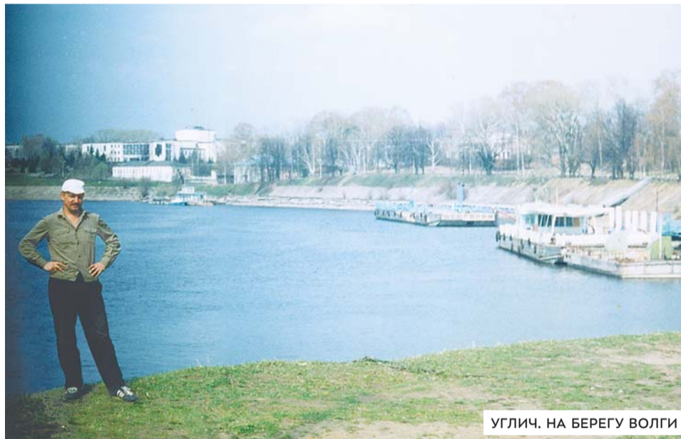
УГЛИЧ. НА БЕРЕГУ ВОЛГИ