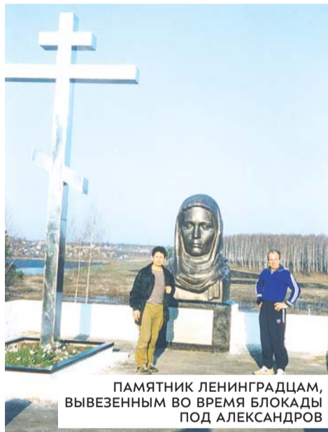
ПАМЯТНИК ЛЕНИНГРАДЦАМ, ВЫВЕЗЕННЫМ ВО ВРЕМЯ БЛОКАДЫ ПОД АЛЕКСАНДРОВ