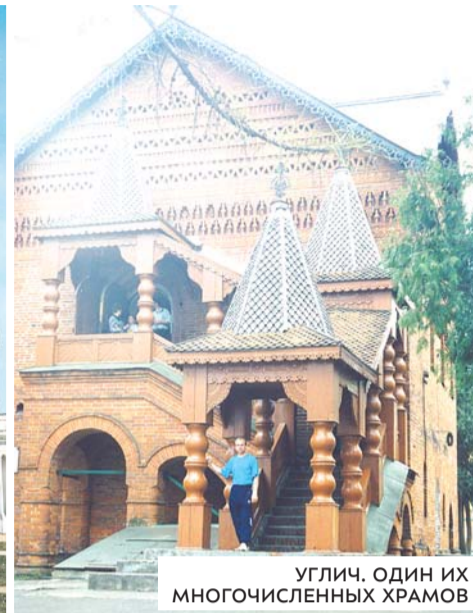
УГЛИЧ. ОДИН ИЗ МНОГОЧИСЛЕННЫХ ХРАМОВ