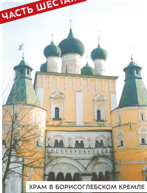
ХРАМ В БОРИСОГЛЕБСКОМ КРЕМЛЕ