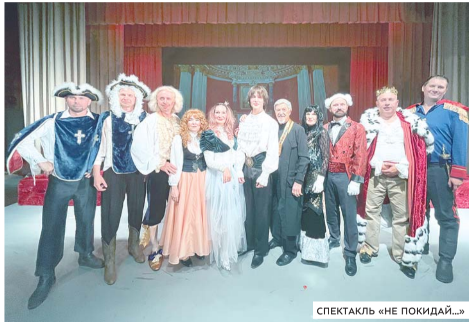
СПЕКТАКЛЬ «НЕ ПОКИДАЙ...»

В трудное постсоветское время, когда костюмеров у нас уже не было, мы своими руками перешивали костюмы из одежды, отрывали украшения от собственных платьев. Сейчас я тоже шью. Вы видите королевскую мантию — настоящую, с белой опушкой, а ведь раньше это был плед! Я пришла к подруге, смотрю: лежит плед подходящий на диване. Говорю: «Отдай!» Она отвечает: «Всё равно — синтетика, забирай». Ей вещь ни к чему, а королю — шикарная мантия. Благодаря театру я очень общительная, могу попросить приглашенную мне вещь. Окружающие знают, и порой случаются забавные ситуации. Пришла к знакомой, смотрю — сундук. Ещё не успела рта раскрыть, она мне говорит: «Не смотри на мой сундук! Я тебе его не отдам!» Но многие отдают или даже сами приносят ставшие ненужными вещи. Свадебное платье, туфли для танцев, кружевные перчатки, галбос — им ни к чему, а нам пригодятся, всемо найдём применение! Молодые актёры говорят: «Сейчас в интернет-магазине закажем». Они не понимают, что зеркало, которое при падении будет звенеть, но не разбиваться, не продаётся, поэтому я им отвечаю: «Нет, нам придётся его сделать!»