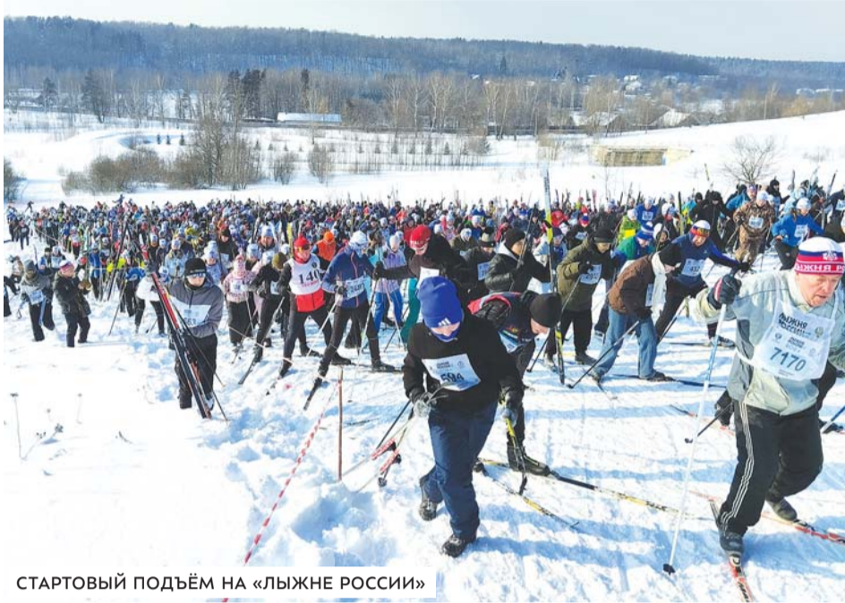
СТАРТОВЫЙ ПОДЪЁМ НА «ЛЫЖНЕ РОССИИ»

Есть в нашей стране праздник, который объединяет всех любителей лыж. Называется он «Лыжня России» и проводится в феврале почти во всех регионах страны. В этом году он состоялся в 42-й раз. На трассы в этот день выходит более полутора миллионов лыжников! Для любителей лыж Подмоскovie и ряда соседних областей его традиционно провели в Химках, на базе Олимпийского учебно-спортивного центра «Планерная».