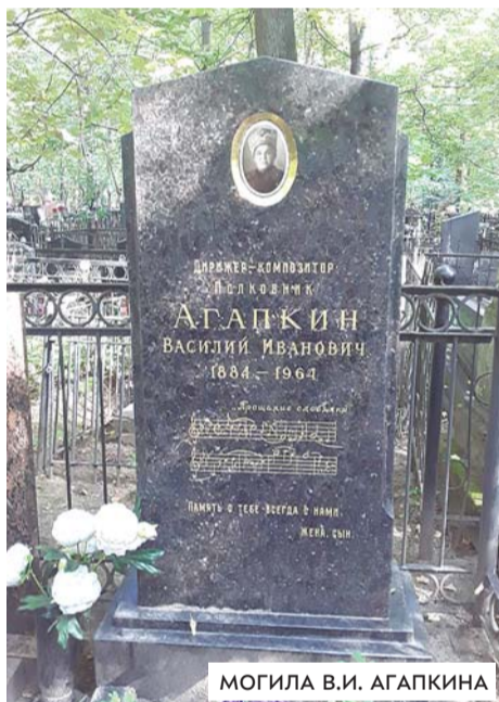
МОГИЛА В.И. АГАПКИНА