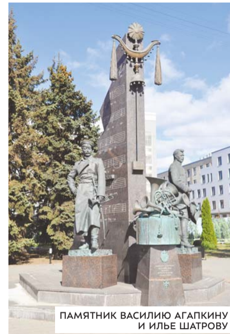
ПАМЯТНИК ВАСИЛИЮ АГАПКИНУ И ИЛЬЕ ШАТРОВУ