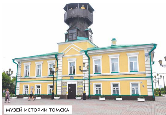
МУЗЕЙ ИСТОРИИ ТОМСКА