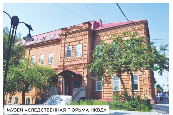
МУЗЕЙ «СЛЕДСТВЕННАЯ ТЮРЬМА НКВД»