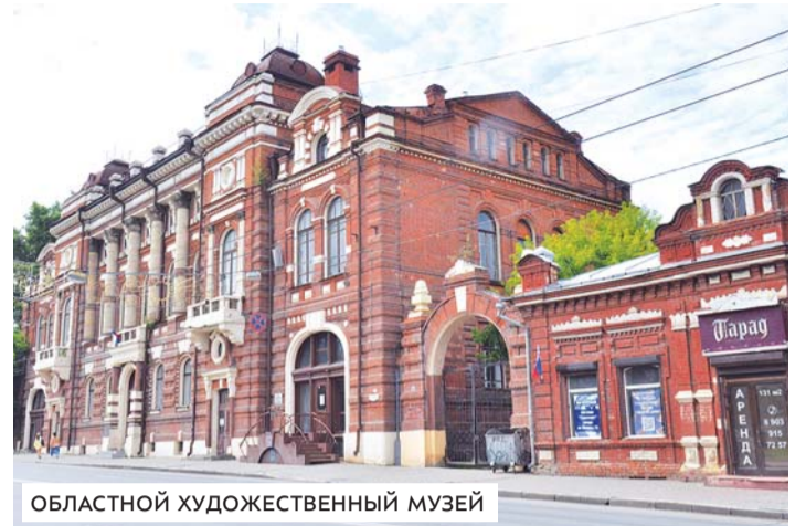
ОБЛАСТНОЙ ХУДОЖЕСТВЕННЫЙ МУЗЕЙ