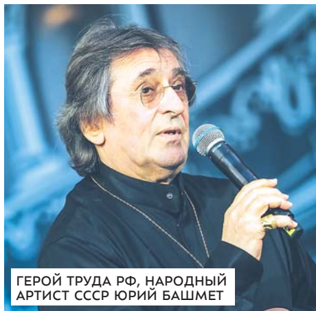
ГЕРОЙ ТРУДА РФ, НАРОДНЫЙ АРТИСТ СССР ЮРИЙ БАШМЕТ

Молодые таланты были награждены в рамках X Международного фестиваля искусств П.И. Чайковского, который прошёл на территории музея-заповедника П.И. Чайковского в Клину с 21 по 30 июня. Дипломы и гранты в