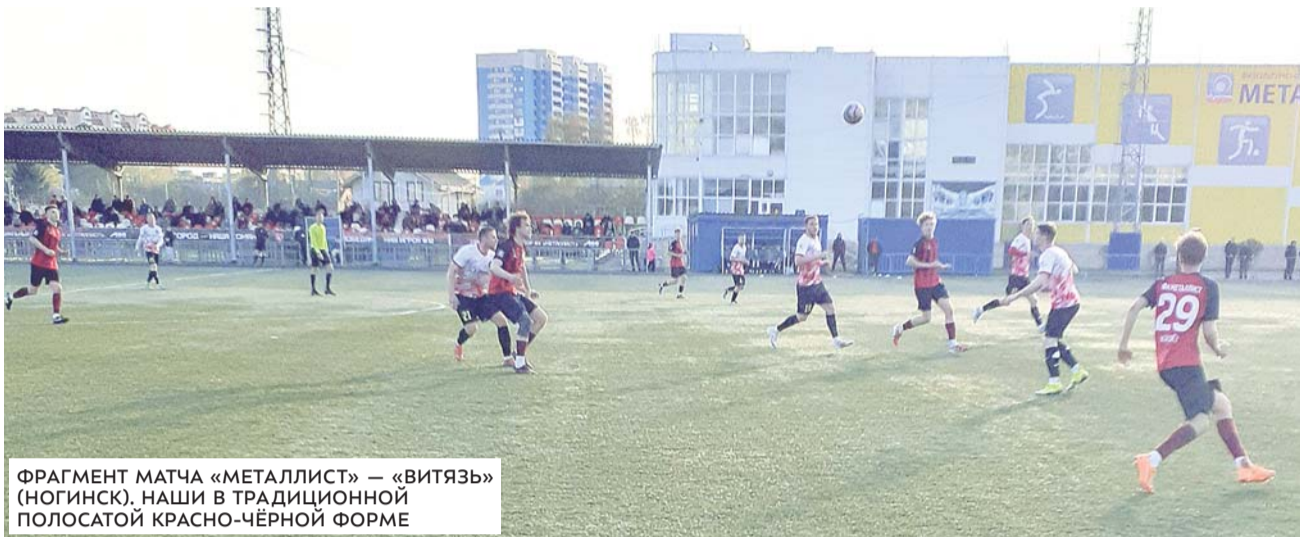
ФРАГМЕНТ МАТЧА «МЕТАЛЛИСТ» — «ВИТЯЗЬ» (НОГИНСК). НАШИ В ТРАДИЦИОННОЙ ПОЛОСАТОЙ КРАСНО-ЧЁРНОЙ ФОРМЕ