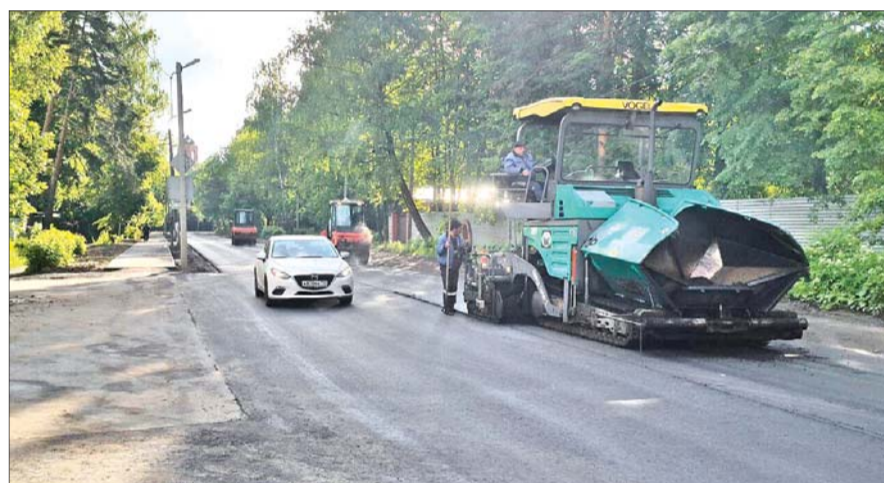
Ремонт на ул. Горького.

Ведётся асфальтировка 9 дворовых территорий общей площадью 66 434 кв. м