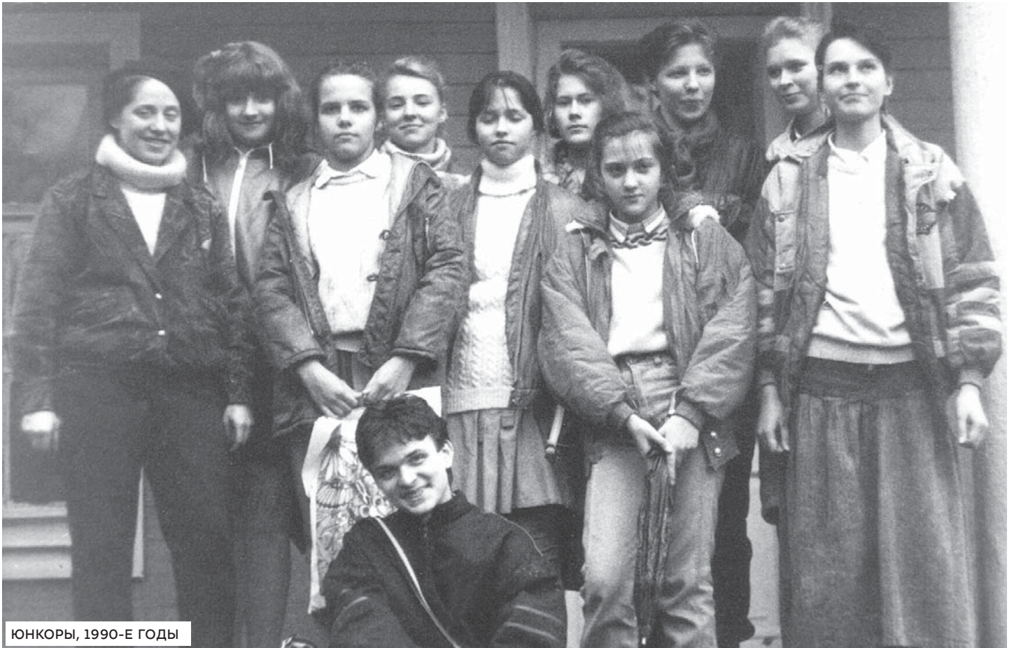
ЮНКОРЫ, 1990-Е ГОДЫ