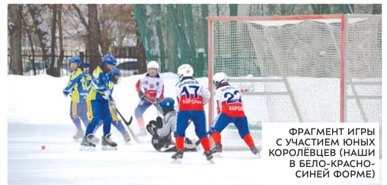
ФРАГМЕНТ ИГРЫ С УЧАСТИЕМ ЮНЫХ КОРОЛЁВЦЕВ (НАШИ В БЕЛО-КРАСНО-СИНЕЙ ФОРМЕ)