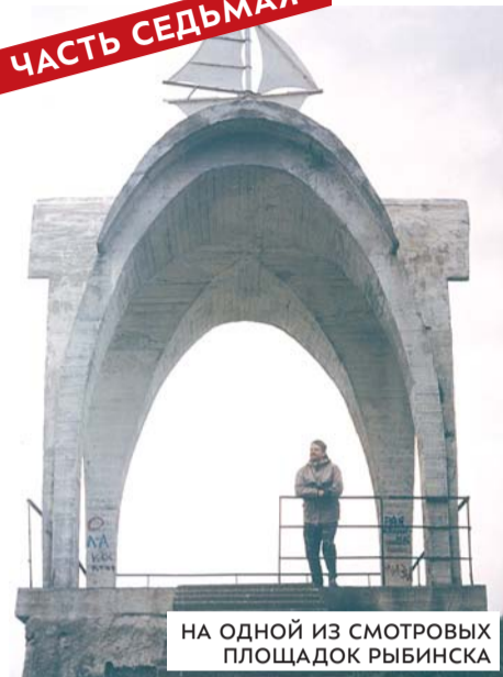
НА ОДНОЙ ИЗ СМОТРОВЫХ ПЛОЩАДОК РЫБИНСКА