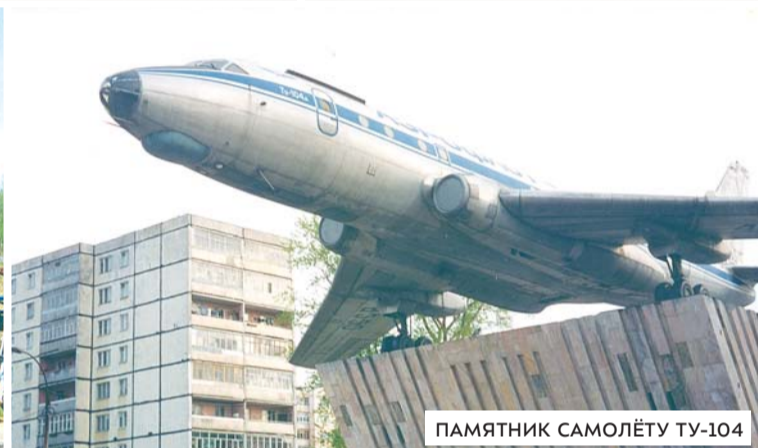
ПАМЯТНИК САМОЛЁТУ ТУ-104