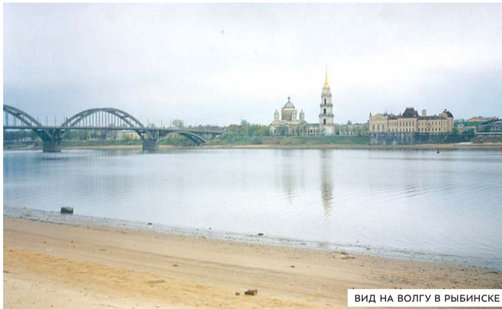
ВИД НА ВОЛГУ В РЫБИНСКЕ