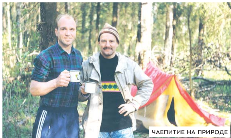
ЧАЕПИТИЕ НА ПРИРОДЕ