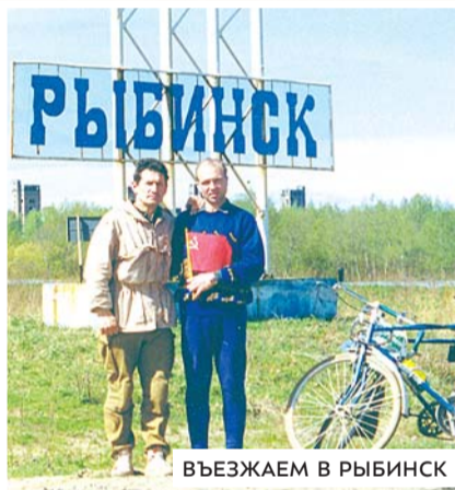
ВЪЕЗЖАЕМ В РЫБИНСК