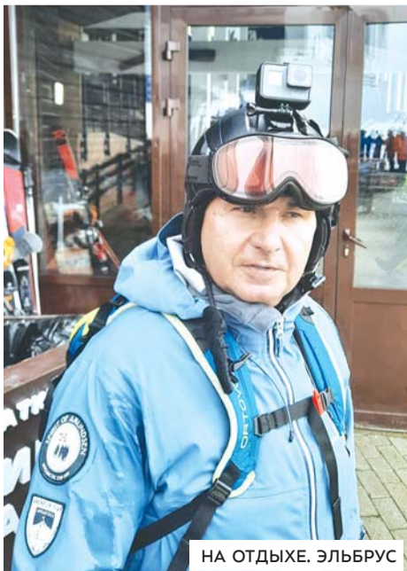
НА ОТДЫХЕ. ЭЛЬБРУС