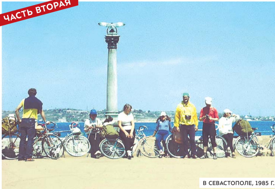
В СЕВАСТОПОЛЕ, 1985 Г.