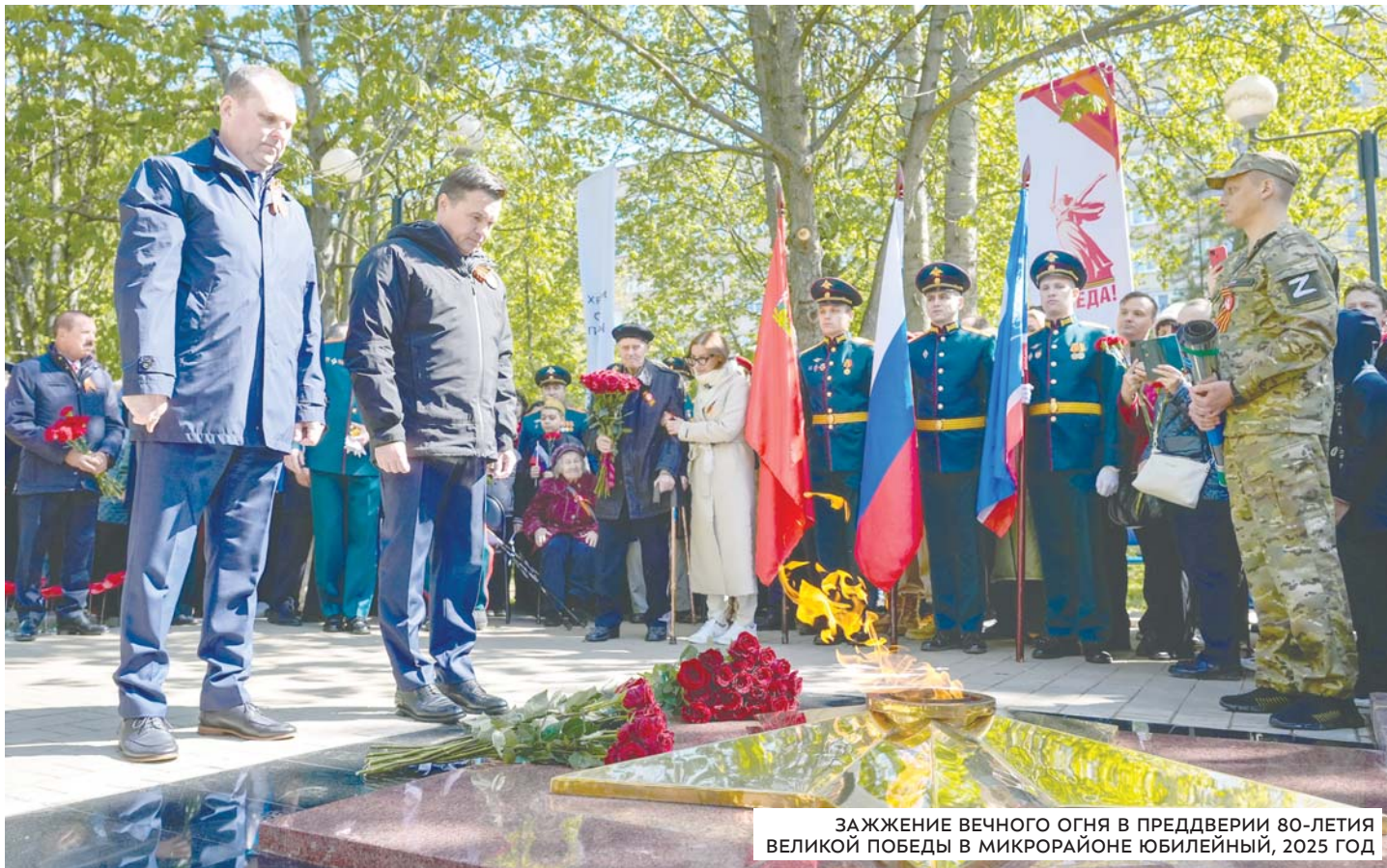
ЗАЖЖЕНИЕ ВЕЧНОГО ОГНЯ В ПРЕДДВЕРИИ 80-ЛЕТИЯ ВЕЛИКОЙ ПОБЕДЫ В МИКРОРАЙОНЕ ЮБИЛЕЙНЫЙ, 2025 ГОД

принимают жители города, ветераны, студенты, школьники. Такие акции помогают создать особую атмосферу единения, причастности к общей истории и героической памяти, которую чувствуют все участники, независимо от возраста.