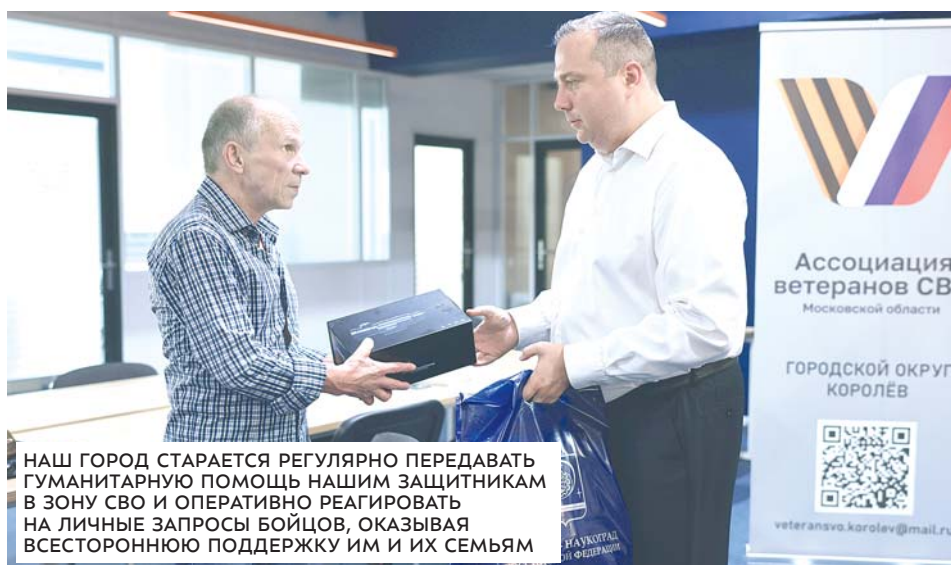
НАШ ГОРОД СТАРАЕТСЯ РЕГУЛЯРНО ПЕРЕДАВАТЬ ГУМАНИТАРНУЮ ПОМОЩЬ НАШИМ ЗАЩИТНИКАМ В ЗОНУ СВО И ОПЕРАТИВНО РЕАГИРОВАТЬ НА ЛИЧНЫЕ ЗАПРОСЫ БОЙЦОВ, ОКАЗЫВАЯ ВСЕСТОРОННЮЮ ПОДДЕРЖКУ ИМ И ИХ СЕМЬЯМ

ные жизненные вопросы, сопровождают при трудоустройстве, оказывают социальную и правовую помощь, вовлекают ветеранов в общественную жизнь города, патриотические и социальные