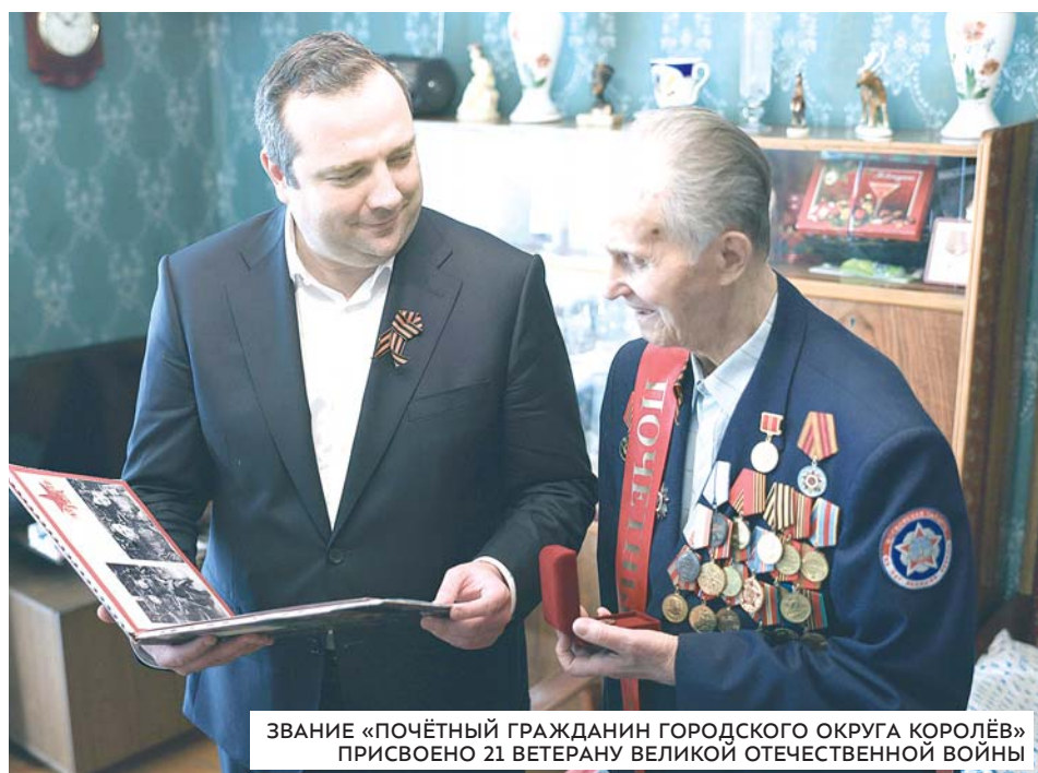
ЗВАНИЕ «ПОЧЁТНЫЙ ГРАЖДАНИН ГОРОДСКОГО ОКРУГА КОРОЛЁВ» ПРИСВОЕНО 21 ВЕТЕРАНУ ВЕЛИКОЙ ОТЕЧЕСТВЕННОЙ ВОЙНЫ

В марте 2025 года в наукограде открылось отделение Ассоциации ветеранов специальной военной опера-